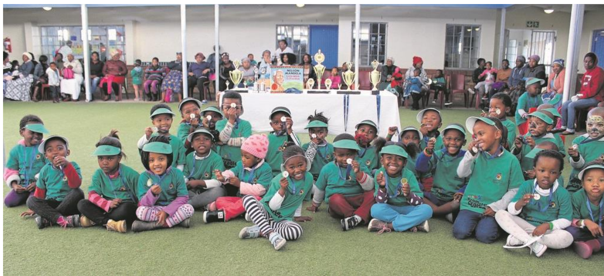
Foto: Kinderen uit ons centrum in Mfuleni gedurende Talent Day 2019

In 2020 is Stichting Afrika Tikkun NL opgericht. Door middel van dit beleidsplan willen we u op de hoogte stellen van (1) onze visie & missie, (2) onze ambities & doelstellingen, (3) onze werkwijze & SWOT en (4) onze strategische doelstellingen en stappenplan.