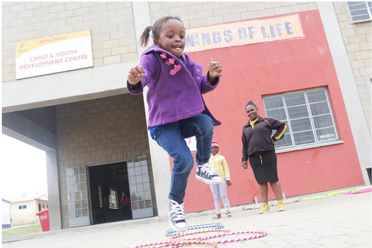
Foto: spelenderwijs leren is mogelijk bij Afrika Tikkun in Diepsloot, Johannesburg

We willen dit bereiken door middel van onze fondsenwerving strategie met bedrijven, individuen en fondsen.