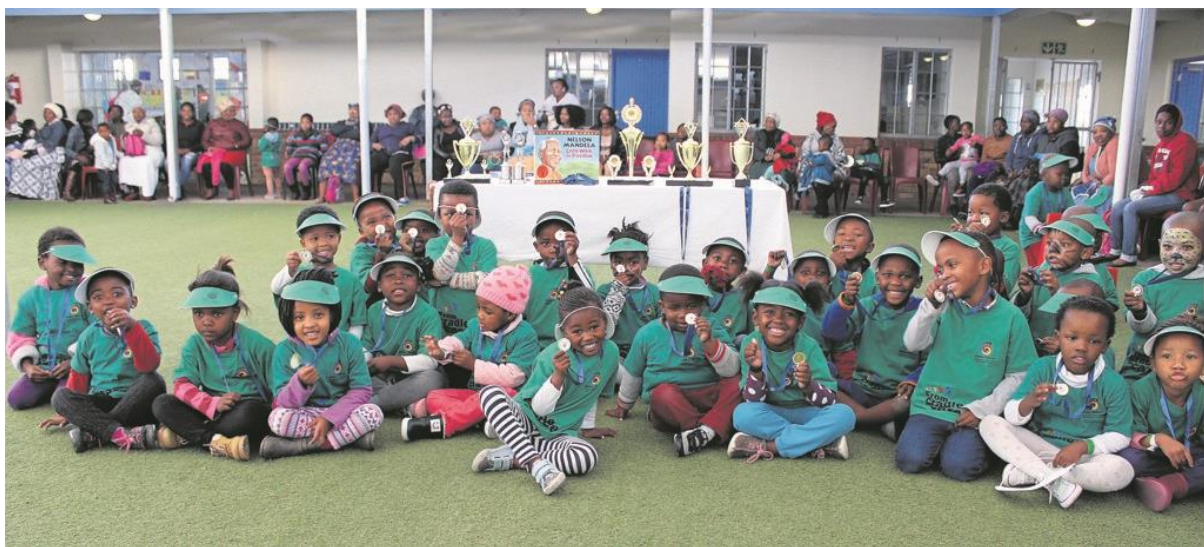
Foto: Kinderen uit ons centrum in Mfuleni

In 2020 is Stichting Afrika Tikkun NL opgericht. Door middel van dit beleidsplan willen we u op de hoogte stellen van (1) onze visie & missie, (2) onze ambities & doelstellingen, (3) onze werkwijze & SWOT en (4) onze strategische doelstellingen en stappenplan.